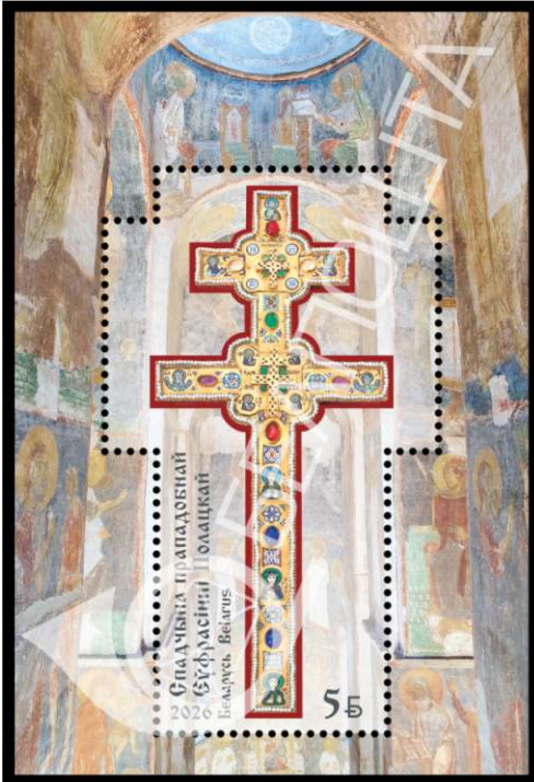
Блок № 172

Блок печатался в РУП «Бобруйская укрупненная типография им. А.Т. Непогодина».