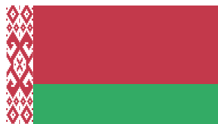
Государственные герб и флаг Республики Беларусь