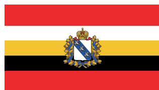
Герб и флаг Курской области

Курская область располагает достаточным промышленным потенциалом. В структуре валового регионального продукта доля промышленности составляет около 40 %.